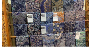
Gambar 3.2 Beberapa Motif Batik Pecel