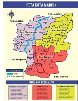
Gambar 2.1 Peta Kota Madiun