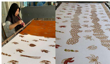
Gambar 3.4 Proses Pewarnaan Batik Pecel

Tahapan penciptaan batik diawali dengan perancangan desain motif diatas kertas. Pada tahap ini, Ibu Murni mempertimbangkan komposisi, pengulangan motif, serta keseimbangan antara ruang kosong dan isian. Setelah desain disetujui, motif dipindahkan ke kain mori menggunakan pensil. Tahap selanjutnya adalah proses nyanting, yaitu menggambar motif menggunakan malam panas dengan canting. Proses nyanting merupakan tahap paling krusial karena menentukan ketajaman motif dan kualitas akhir batik. 24