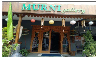
Gambar 4.1 Galeri Batik Murni Madiun