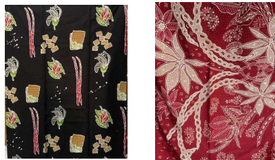
Gambar 3.3 Batik Pecel

Motif Batik Pecel Madiun diciptakan dengan mengadaptasi unsur-unsur visual dari pecel, seperti sayur mayur dan bumbu pecel, ke dalam bentuk ornament batik. Unsur-unsur tersebut tidak digambarkan secara realistis, melainkan distilisasi agar sesuai dengan kaidah estetika batik tradisional. Proses stilisasi ini membutuhkan kepekaan artistik agar motif tetap mudah dikenali namun tidak kehilangan nilai seni. 23