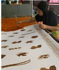
Gambar 4.2 Pegawai yang sedang mewarnai Batik Pecel