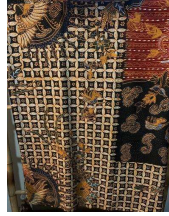
Gambar 3.7 Batik Pecel Burung Cendrawasih